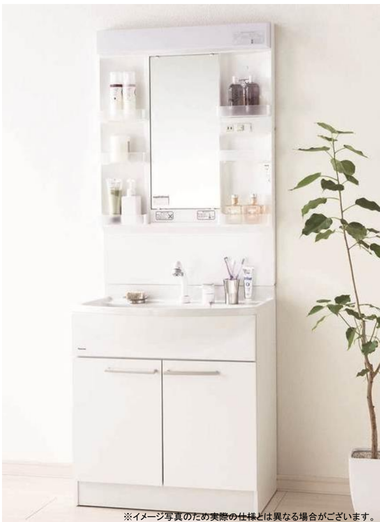
※イメージ写真のため実際の仕様とは異なる場合がございます。